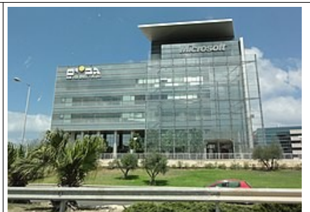
Microsoft House in Herzlia

Nog meer? Op deze pagina van facebook staat nog een lijstje uitvindingen die je dan moet uitschakelen – waarna je zo ongeveer bent afgesloten van de buitenwereld.