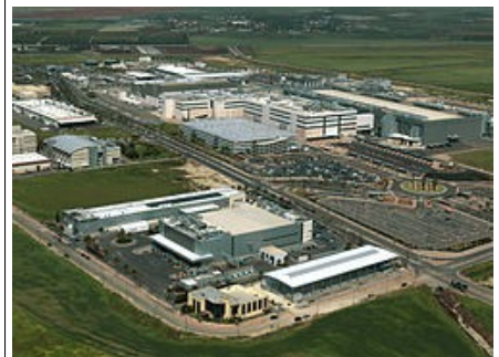
Fabrieken van HP, Intel en Micron in Kiryat Gat

Bronnen: wikipedia.org/Internet_in_Israel , wikipedia.org/List_of_Israeli_inventions_and_discoveries ; wikipedia.org/Silicon_Wadi ; facebook .