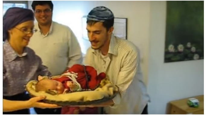
Een screenshot uit de video over een pidyon haben, https://youtu.be/Rwd08M7pr3A

Op zijn website vertelde Bart Gijsbertsen bij de uitleg van dit Bijbelgedeelte over dit eeuwenoude ritueel in Joodse kring, pidyon haben , het vrijkopen van de zoon: