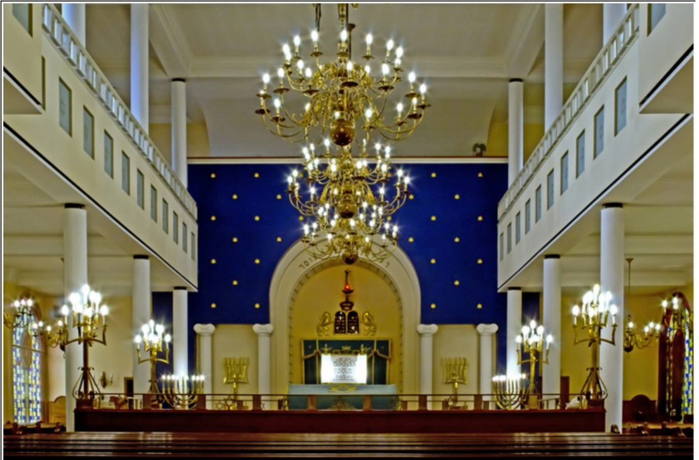
Interieur van de hoofdsynagoge van de Israëlitische Gemeente Antwerpen 'Shomre Hadat'