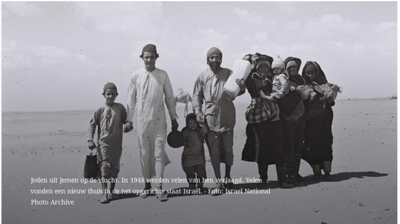
Joden uit Jemen op de vlucht. In 1948 werden velen van hen verjaagd. Velen vonden een nieuw thuis in de net opgerichte staat Israël.

Na deze geweldsexplosie besloot de Israëlische regering hen op te halen. Tussen juni 1949 en september 1950 evacueerden tijdens de Operation Magic Carpet Britse en Amerikaanse vliegtuigen ongeveer 49.000 Joden vanuit Jemen naar Israël. Het overgrote deel van deze groep die bestond uit 47.000 Joodse Jemenieten, 1.500 uit Aden alsook 500 Joden uit Djibouti en een aantal Joden uit Eritrea.