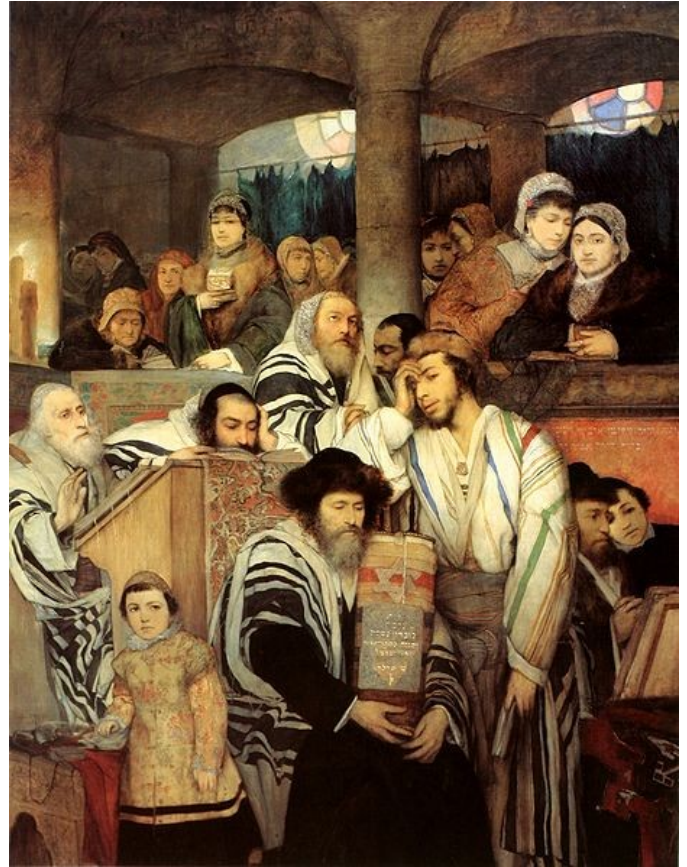
Joden biddend in de synagoge op Yom Kipoer; Mauryc Gottlieb, 1878.

Alle gebeden staan in het teken van inkeer, en mannen dragen soms een wit doodskleed (kittel of sargenes), als symbool voor onschuld of zuiverheid, en om aan onze sterfelijkheid te herinneren. De kleden in de sjoel zijn al vanaf