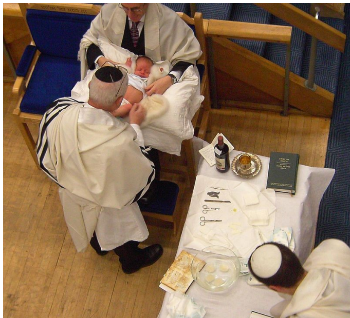
Vorbereidingen voor een Joodse besnijdenis

www.ynetnews.com/articles/0,7340,L-4529725,00.html